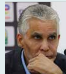
بقلم .... زين العابدين بركان