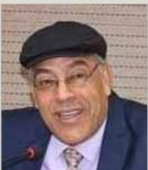
بقلم .... فتحي حمزة